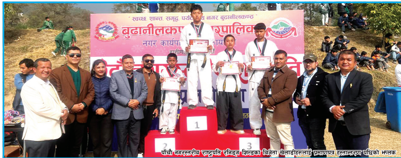
पाँचौं बमरस्तरीय राष्ट्रपति रनिङ्ग शिल्डको विजेता खेलाडीहरूलाई प्रमाणपत्र हस्तान्तरण पछिको भेलक