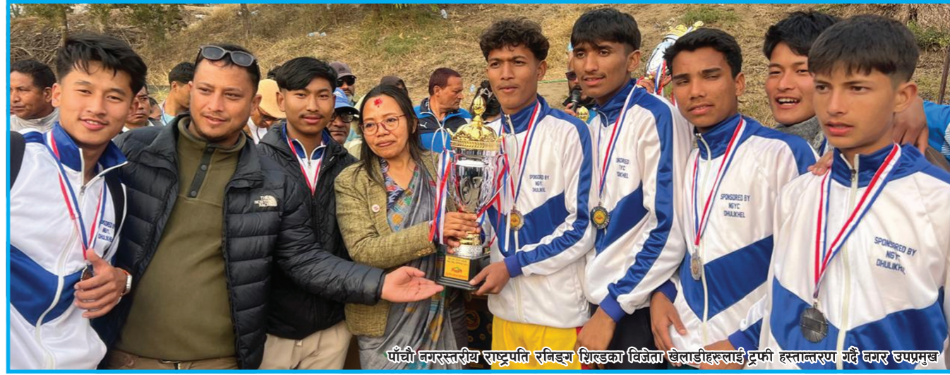
पाँचौं बमरस्तरीय राष्ट्रपति रनिङ्ग शिल्डका विजेता खेलाडीहरूलाई ट्रफी हस्तान्तरण गर्दै बमर उपप्रमुख