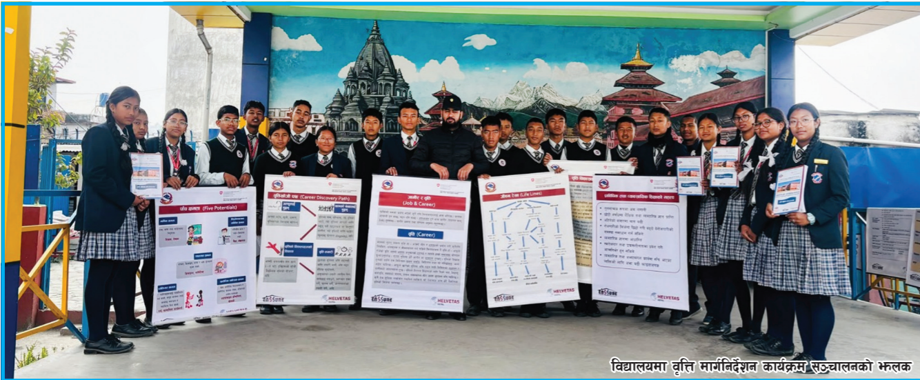
विद्यालयमा वृत्ति मार्गनिर्देशन कार्यक्रम सञ्चालनको भ्रमण