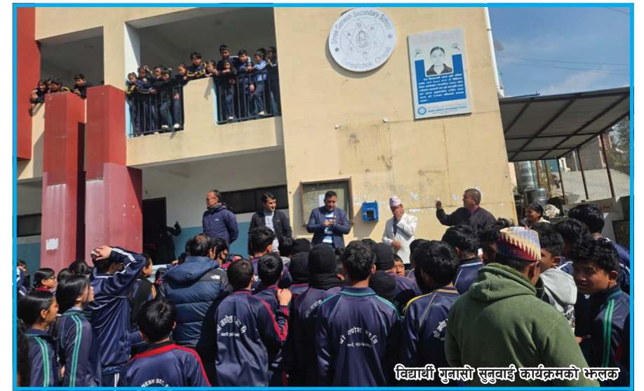
विद्यार्थी गुनासो सुनुवाई कार्यक्रमको फेरबदल