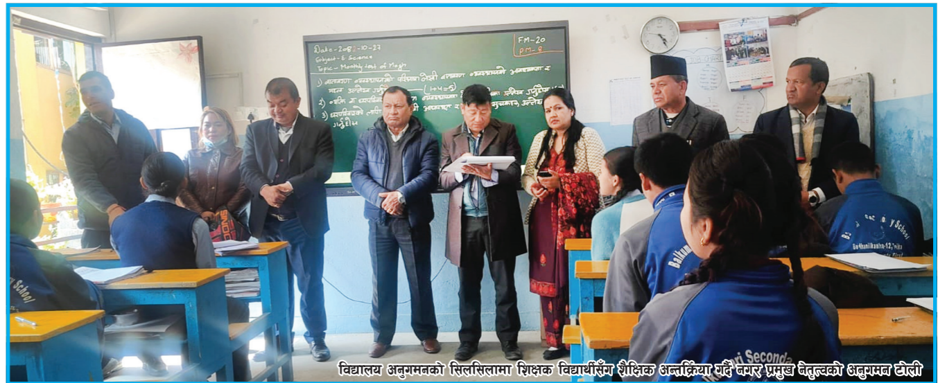
विद्यालय अनुगमनको सिलसिलामा शिक्षक विद्यार्थीसँग शैक्षिक अन्वेषण गरी उत्कृष्ट प्रमुख विद्यार्थीको अनुगमन गर्दै