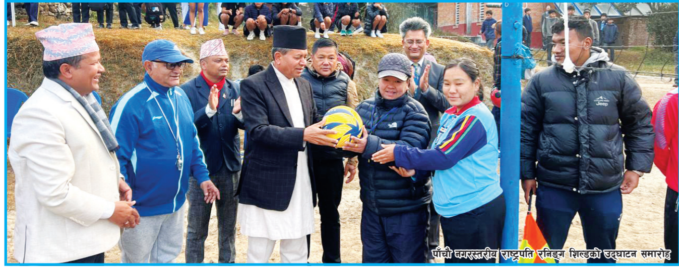
पाँचौं बमरस्तरीय राष्ट्रपति रनिङ्ग शिल्डको उदघाटन समारोह