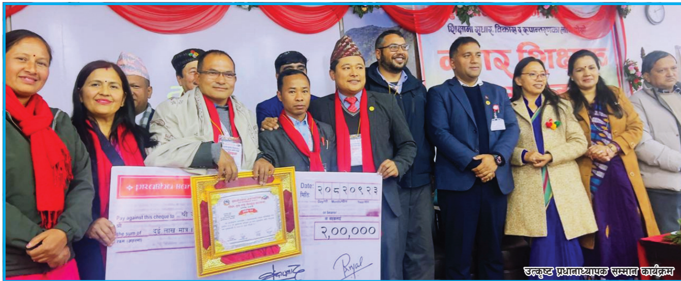
उत्कृष्ट प्रयासाध्यक सम्मान कार्यक्रम