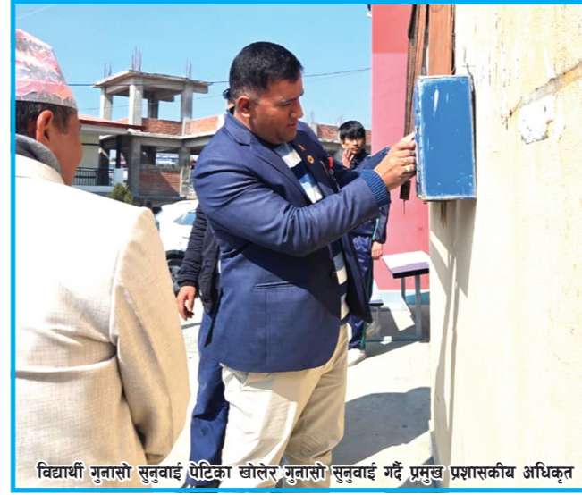
विद्यार्थी गुनासो सुनुवाई पेटिका खोलेर गुनासो सुनुवाई गर्दै प्रमुख प्रशासकीय अधिकृत