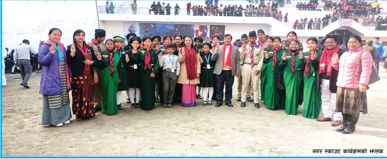
नगर स्काउट कार्यक्रमको भ्रमण