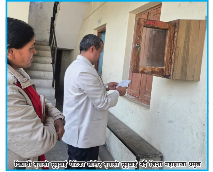
विद्यार्थी गुनासो सुनुवाई पेटिका खोलेर गुनासो सुनुवाई गर्दै शिक्षा महाशाखा प्रमुख