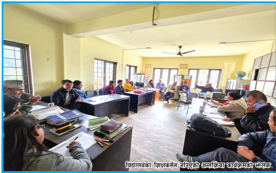
विद्यालयका शिक्षकसँग परिसरको अन्तर्गतका कार्यक्रमको फेरबदल