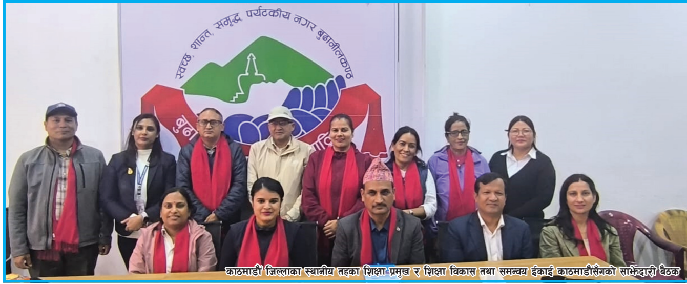
काठमाडौं जिल्लाका स्थानीय तहका शिक्षा प्रमुख र शिक्षा विकास तथा समन्वय ईकाई काठमाडौंसँगको साभेदारी बैठक