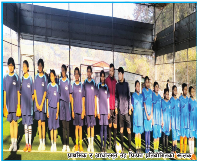
प्राथमिक र आधारभूत तह फिफा प्रतियोगिताको भेलक