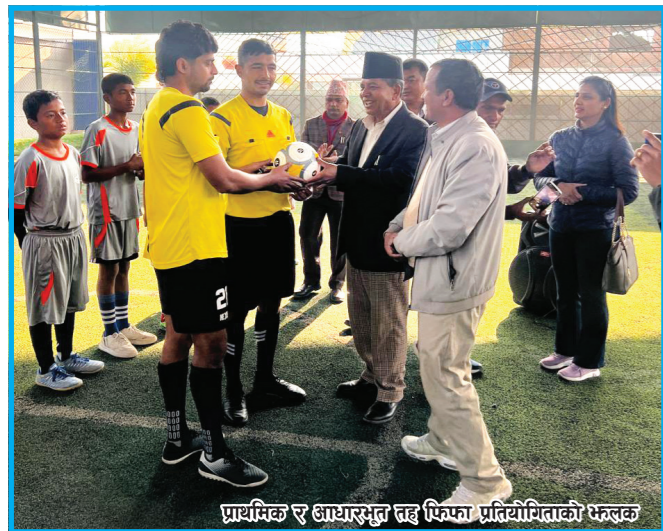
प्राथमिक र आधारभूत तह फिफा प्रतियोगिताको भेलक