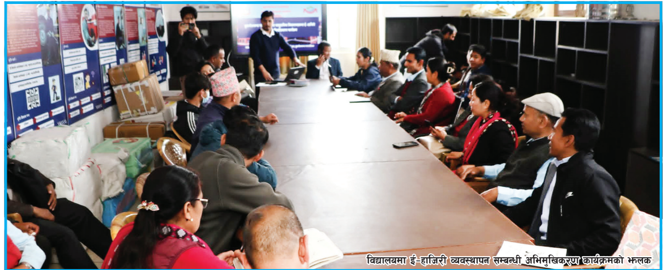
विद्यालयमा ई-हाजिरी व्यवस्थापन सम्बन्धी अभिमुखिकरण कार्यक्रमको भ्रमण