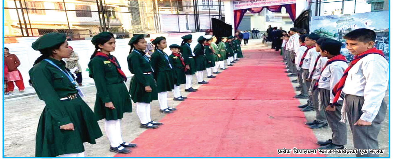
प्रत्येक विद्यालयमा स्काउट कार्यक्रमको एक भ्रमण